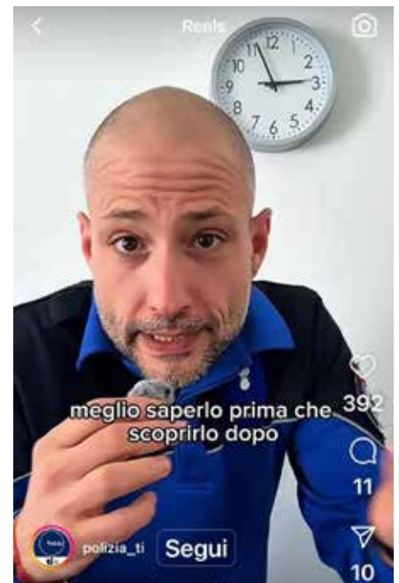
L'influencer della polizia su Instagram.

capi e capetti, adesso è la volta dell' influencer che su Instagram insegna ai ticinesi come far girare la lancetta dell'orologio quando arriva l'ora legale. Capi e capetti seduti alle scrivanie , psicologi, ufficio stampa da far invidia al Consiglio Federale, personal trainer contro la pancetta e ora anche l'influencer . È questa la politica del risparmio della Lega dei Ticinesi 4.0? Altro che iniziativa per diminuire i funzionari!